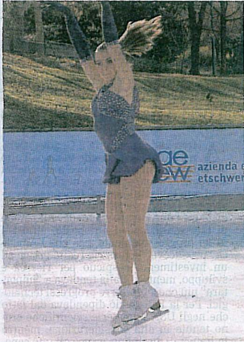
Sopra una pattinatrice di «Bolzano On Ice». A destra l'inaugurazione della pista