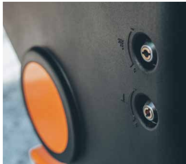
unten links: kugelmann Streugutförderschnacke unten rechts: Handeinstellung Streubreite, -dicke