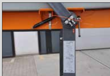
Der Streuer kann mit gefüllten Behältern – bis zu 14 Tonnen – abgestellt werden, was für eine kürzere Reaktionszeit bei Einsätzen sorgt.