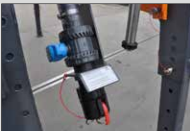
Der Bediengriff zur Solebefüllung und -entleerung sowie die Pläne befinden sich hinten am Streuer und sind vom Boden aus einfach erreichbar.