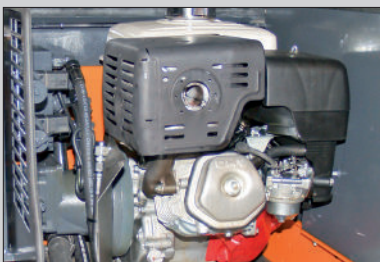
IGLOO wird mit Honda-Benzinmotor oder Hatz-Dieselmotor geliefert.