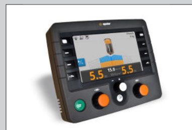
Option: EpoMaster X1, die GPS-gesteuertes Streuen und Datenerfassung ermöglicht.