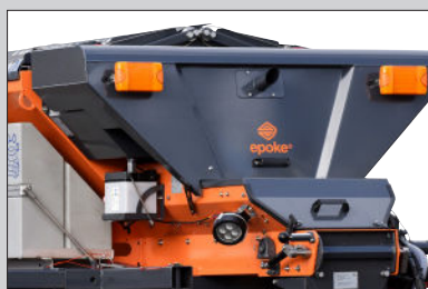
Verbesserter Schutz des Maschinenraums.

(*Gilt nicht für die Version mit 600 l).