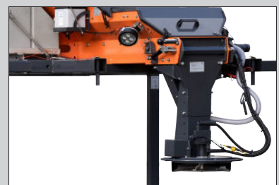
Erhältlich mit langem hinteren Ende für eine optimale Schwerpunktplatzierung. Streuteller und Trichter aus Edelstahl.