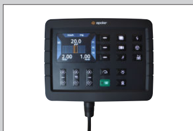
Die Bedienung des Bandstreuers erfolgt standardmäßig mit der EpoMini X1-Fernbedienung.