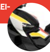
Heritage White IV