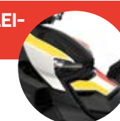
Heritage White IV