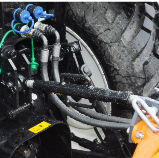
Der PMH 1,4 wird von einer Hydraulikpumpe