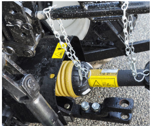
Der PM 1,4 wird vom Nebenabtrieb des Traktors betrieben.