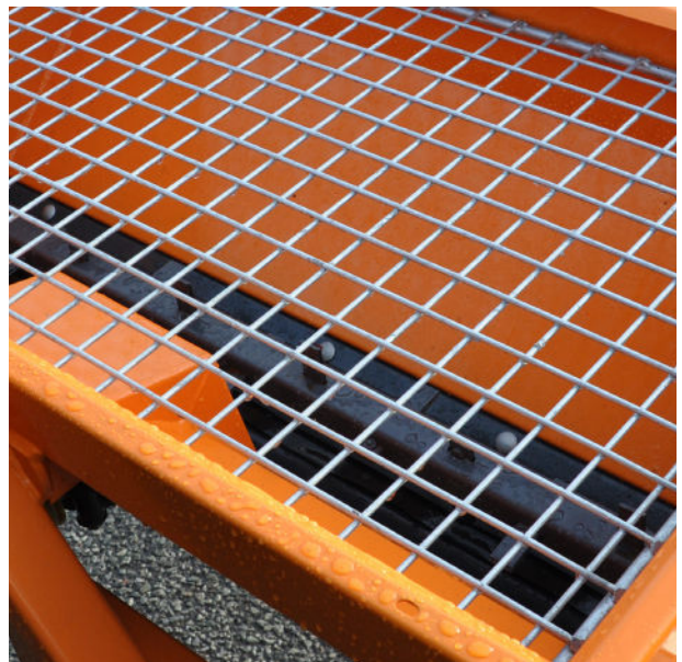
Das Schutzgitter verhindert unbeabsichtigten Zugang zum Umrührer und zur Auslegewalze.