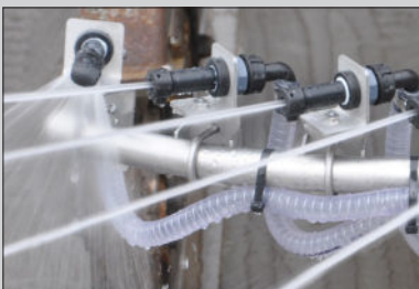
Hochgeschwindigkeitsstreuen mit Spratronic-Düsen. Streut bei allen Geschwindigkeiten bis zu 90 km/h.