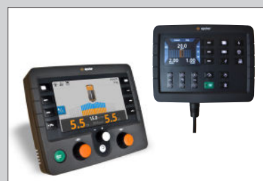
Fernsteuerungsmöglichkeiten: EpoMini X1 oder EpoMaster X1.