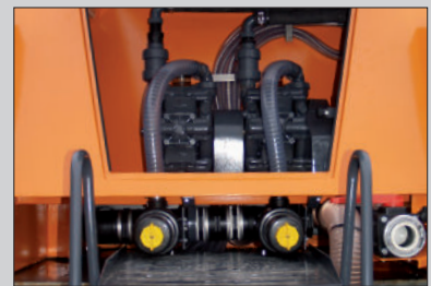
Wartungsfreundlicher Maschinenraum mit schnellem Zugang zu Computereinheit, Ventilen und Solepumpen.