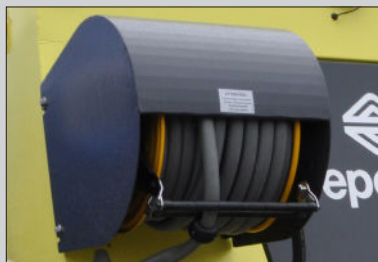
Optional kann eine Schlauchrolle montiert werden.