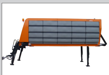
Modular aufgebaute Soletanks.